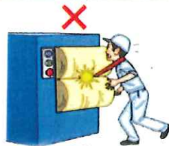
はさまれ・巻き込まれ災害