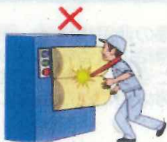
はさまれ・巻き込まれ災害