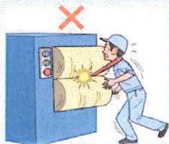
はさまれ・巻き込まれ災害