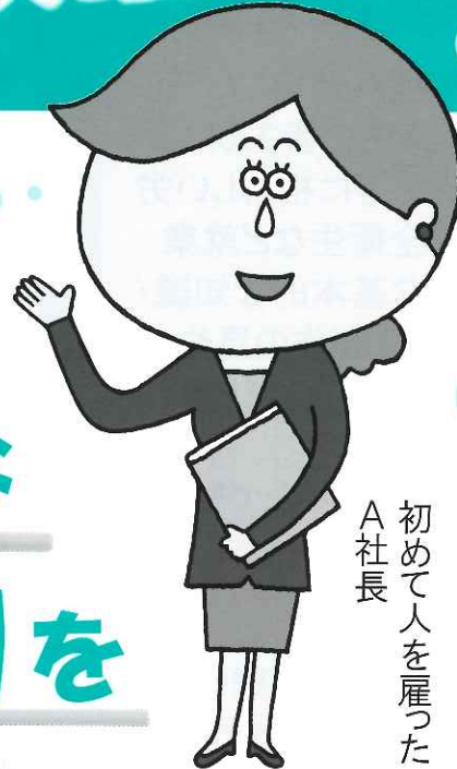
A社長 初めて人を雇った