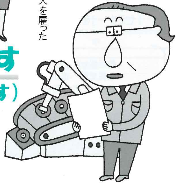
B工場長 異業種へ 進出した